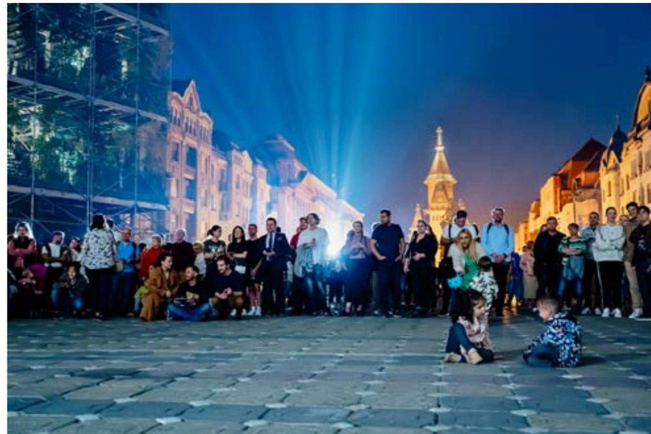
Fotografie de la Libertate?, 14 octombrie 2023, în Piața Victoriei.

Textul este parte din articolul scris de Irina Munteau în numărul de toamnă/iarnă 2023/2024 al Glamour România.