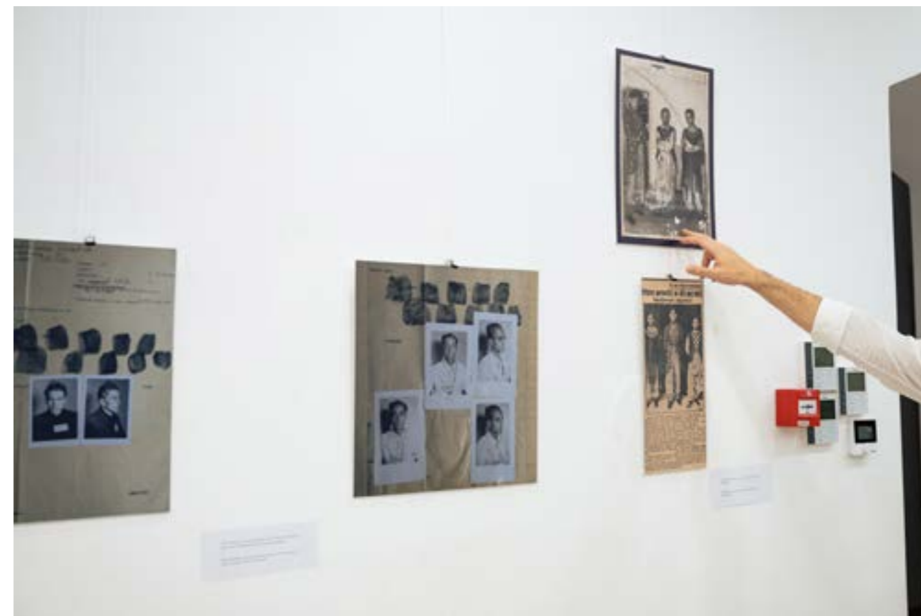
Fotografi de la expoziția Queer Love: Muzeul Istoriei și Culturii Queer, octombrie 2023, la spațiul de expozițional Centrul de Proiect Timișoara