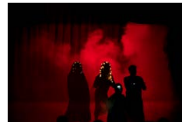
Fotografii de la premiera națională transLucid în Timișoara, 17 mai 2023