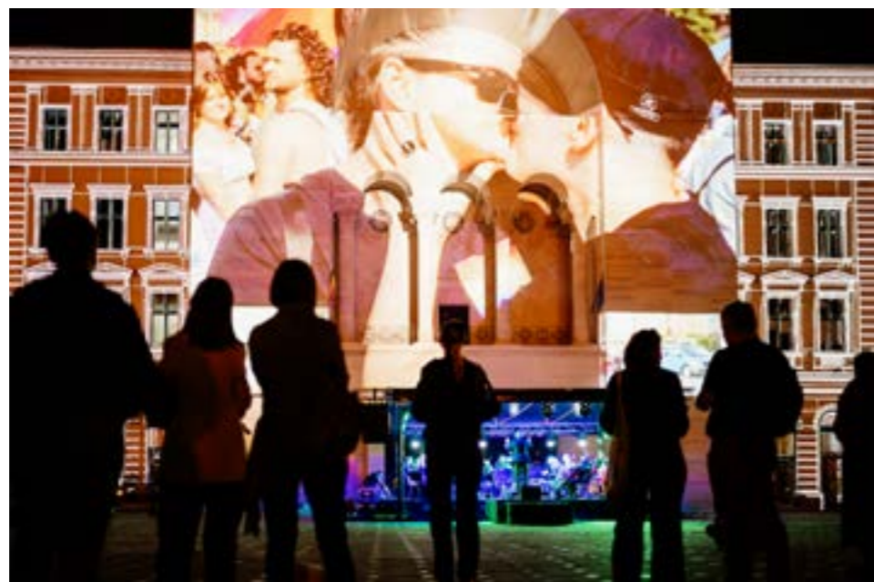
Fotografie de la Libertate?, 14 octombrie 2023, în Piața Victoriei.