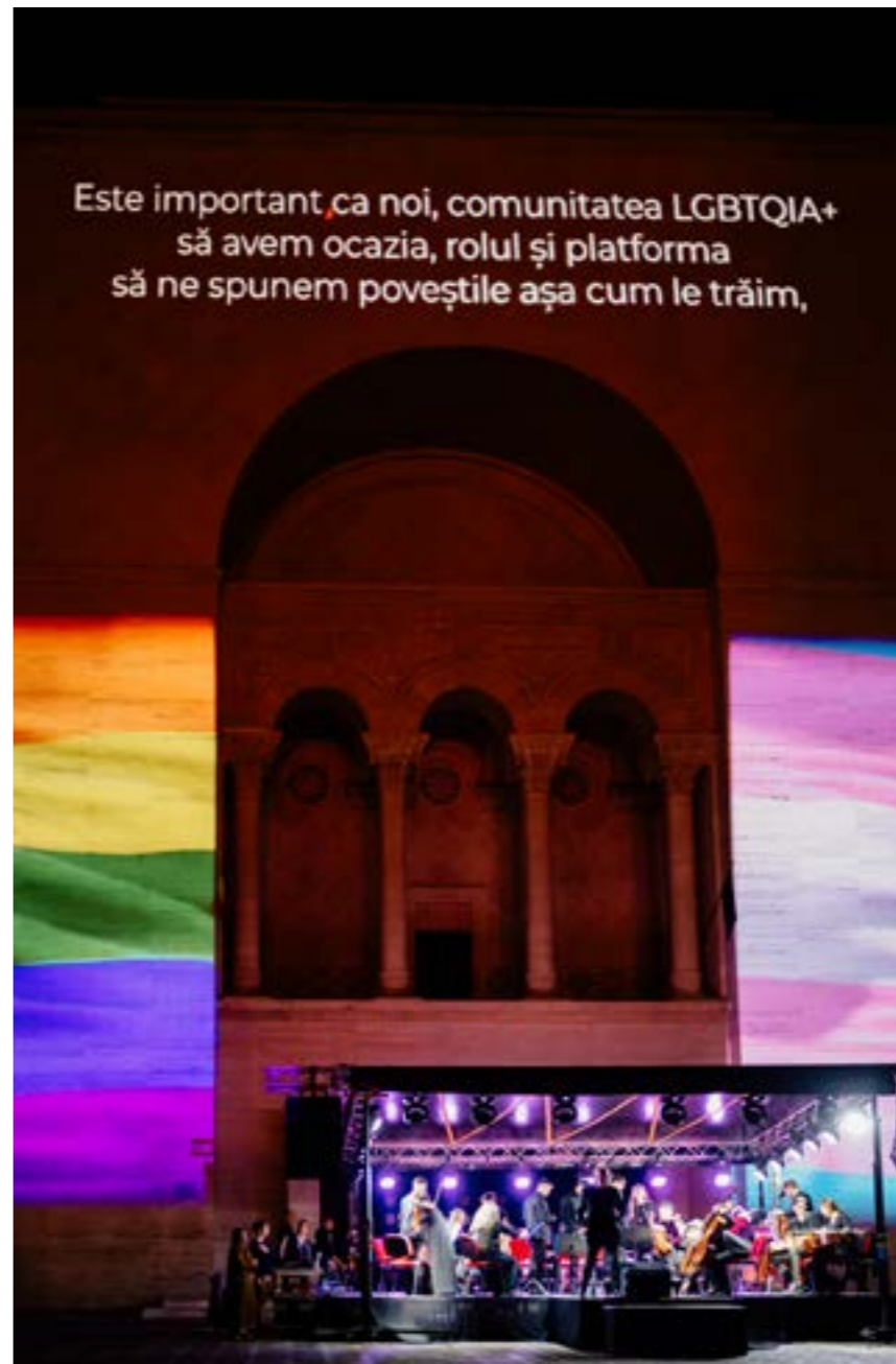
Fotografie de la Libertate?, 14 octombrie 2023, în Piața Victoriei.