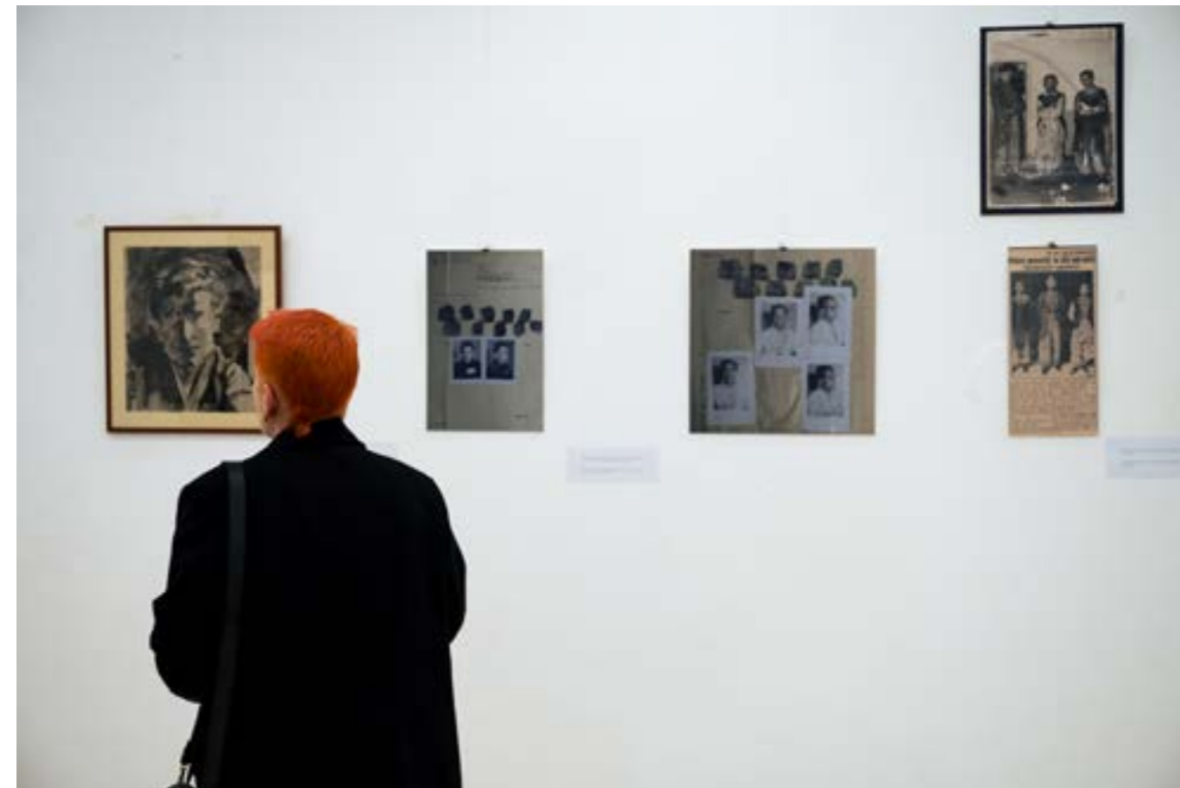
Fotografie de la expoziția Queer Love: Muzeul Istoriei și Culturii Queer, octombrie 2023, la spațiul de expozițional Centrul de Proiect Timișoara

Arta ne dă șansa de a fi noi înșine și de a imagina cine putem fi. Aduce la suprafață proiecții, iubiri și intimități uitate sau ecranate din istorie și din prezent. Recrutează zeități, țărani și proletari, artiști și artiste care chestionează ori sfidează norma. E despre cei care trebuie să ocupe spațiul public pentru a nu fi ignorați și stigmatizați. E despre noi și familiile noastre trăind într-o societate ostilă.