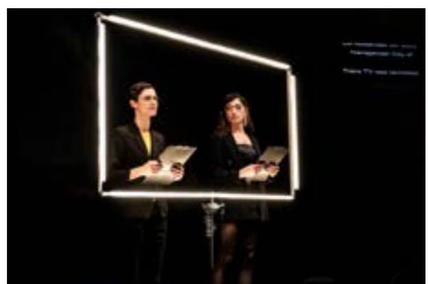
Fotografii de la premiera națională transLucid în Timișoara, 17 mai 2023