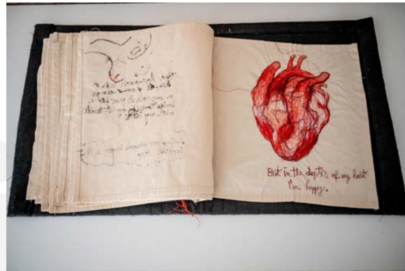
DIANA MATILDA CRIȘAN One Love Feeds The Fire - about grief, 2022