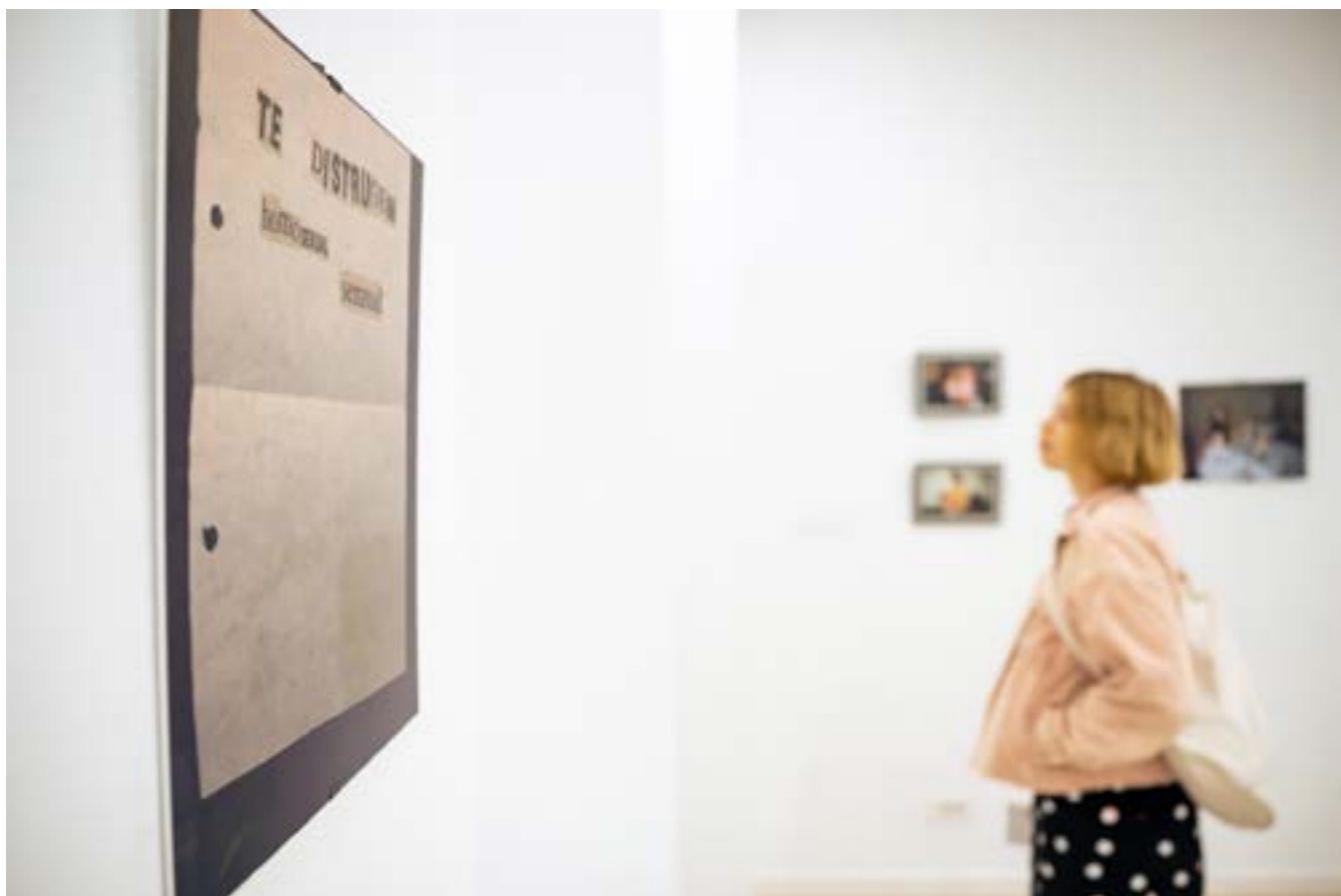
Fotografie de la expoziția Queer Love: Muzeul Istoriei și Culturii Queer, octombrie 2023, la spațiul de expozițional Centrul de Proiect Timișoara