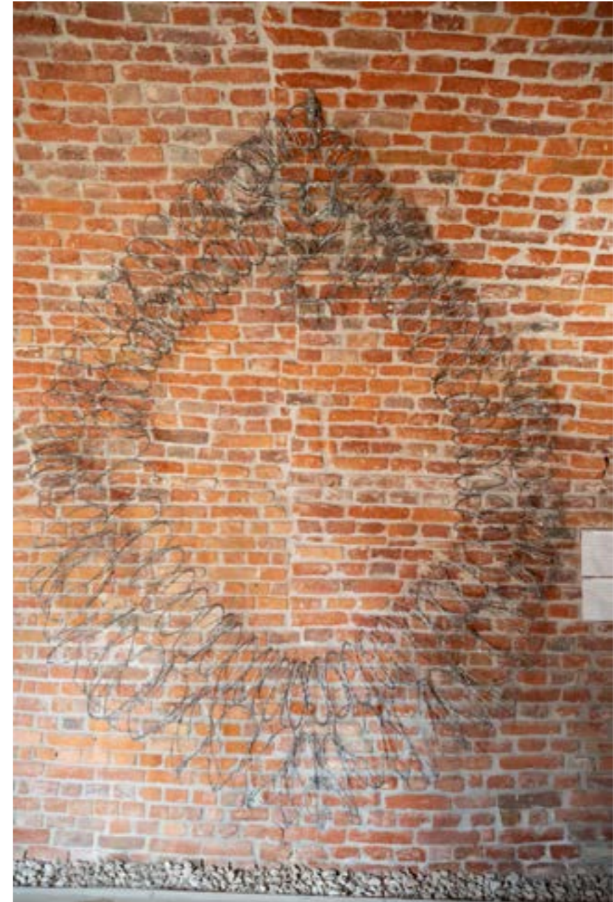
YISHAY GARBASZ Untitled Vagina, 2022