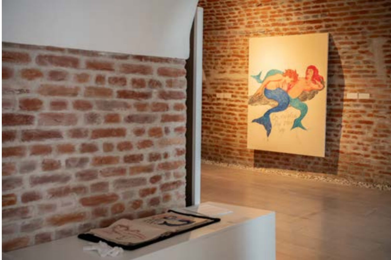
DIANA MATILDA CRIȘAN Melusine, 2021