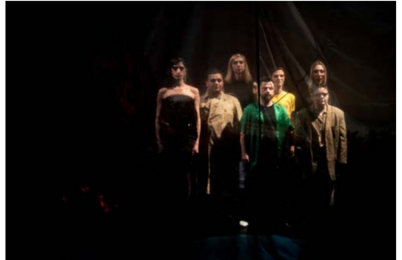
Fotografie de la premiera națională transLucid în Timișoara, 17 mai 2023

A durat foarte mult până ca lucrurile să se schimbe și am luptat enorm ca să ajungem unde suntem acum.