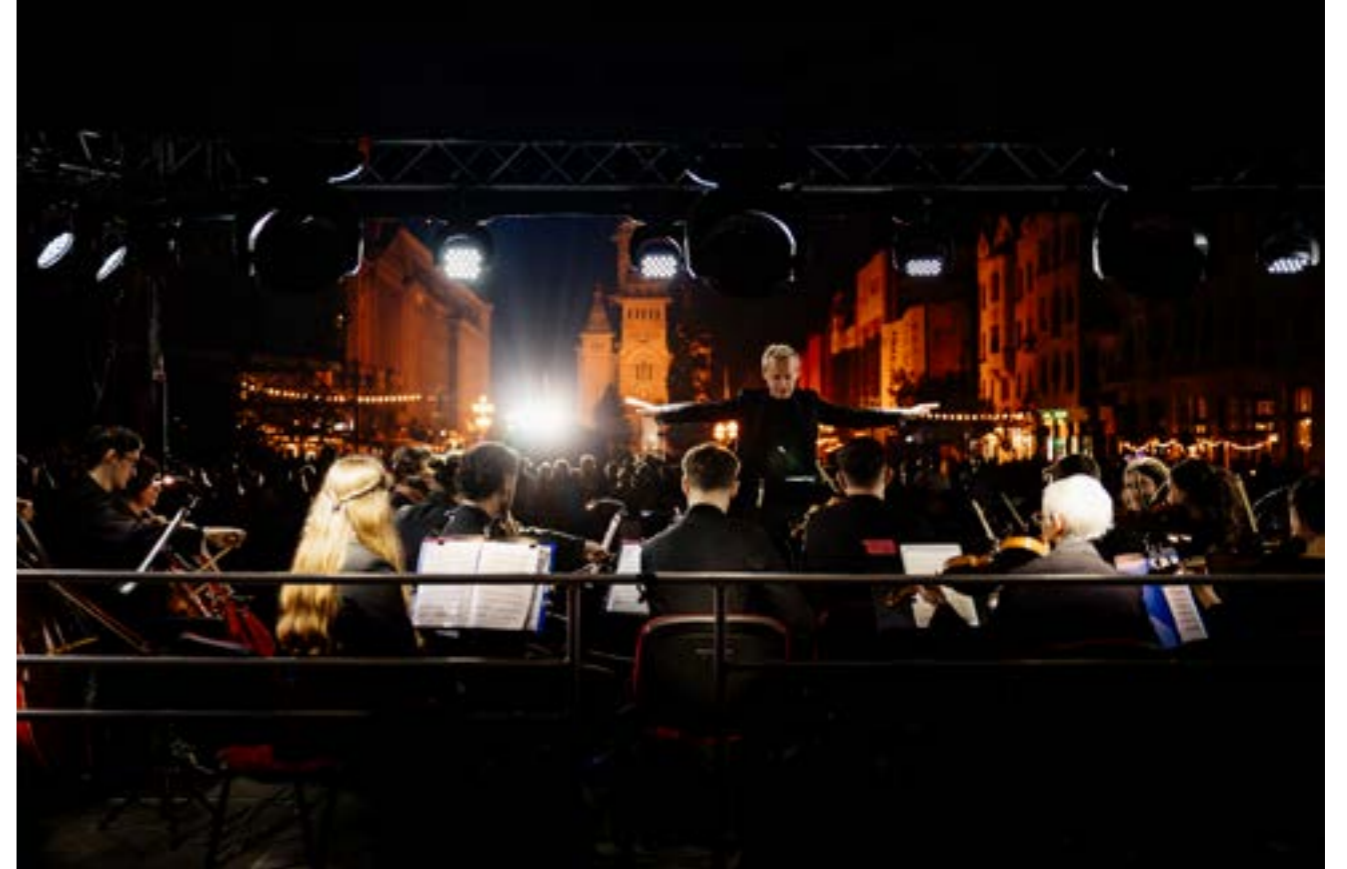
Fotografie de la Libertate?, 14 octombrie 2023, în Piața Victoriei.