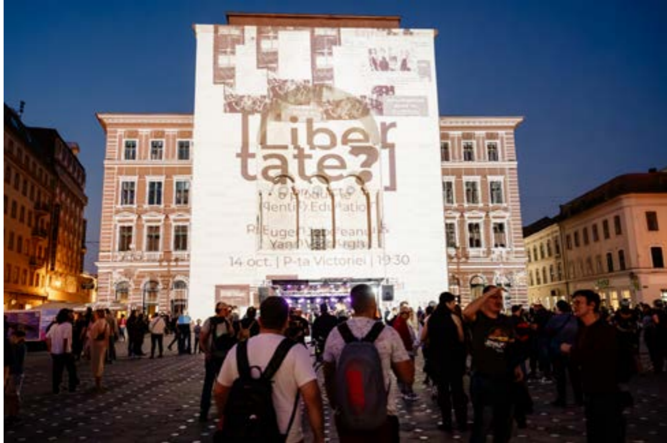
Fotografie de la Libertate?, 14 octombrie 2023, în Piața Victoriei.