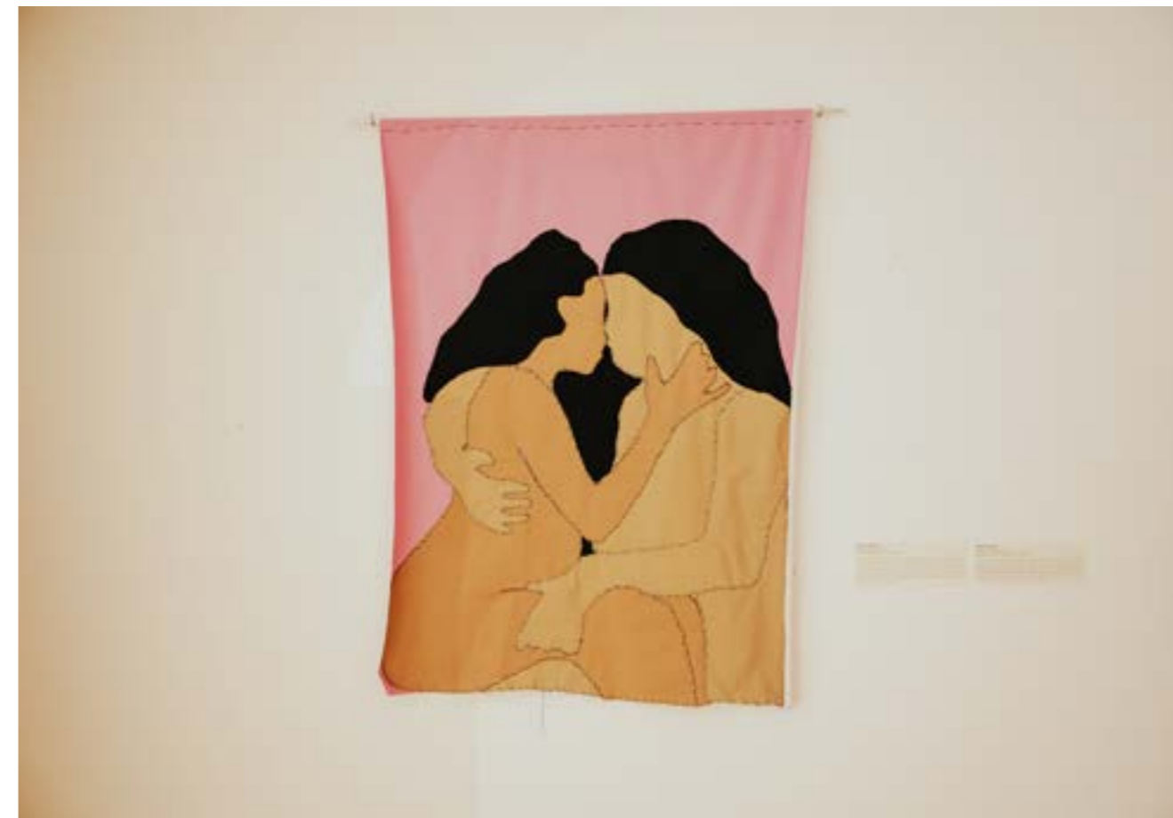
SOPHIE UTIKAL Need to Touch, 2020